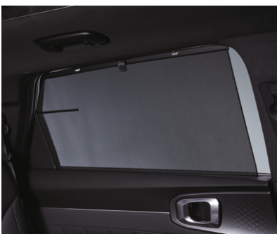
Ikkinchi qator o'rindiqlari uchun quyoshdan himoya qiluvchi pardalar