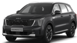
Interstellar Gray (AGT)