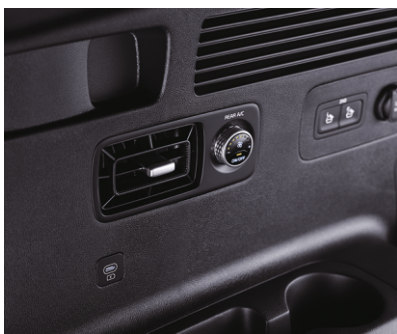
Uchinchi qator o'rindiqlari uchun konditsioner