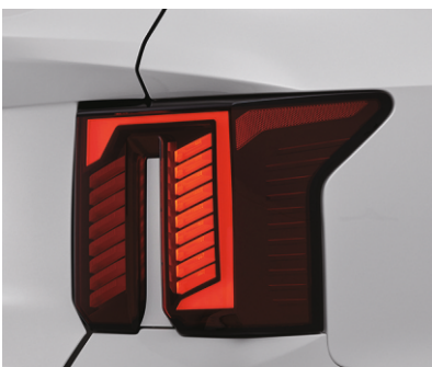
Yorug'liodli orqa chiroqlar