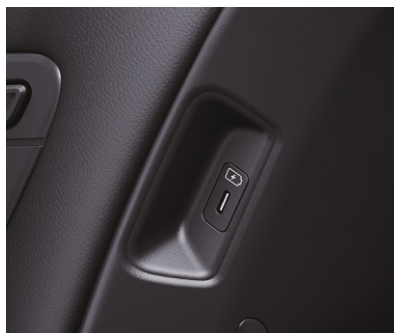
Birinchi qator o'rindiqlar orqa qismidagi qo'shimcha USB zaryadlovchi quрилmalar