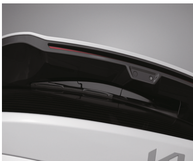
Orqa oynadagi yashirin oyna tozalagich