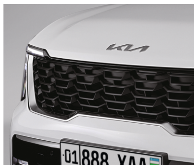
Qora rangli radiator panjarasi