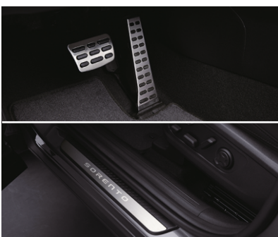
Pedallarda/eshik bo'sag'alardagi metall qoplamalar