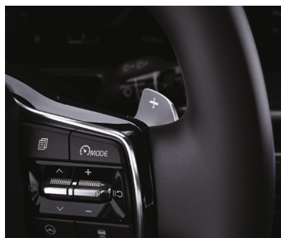
Uzatmalarni almashtirish rulosi "yaproqlari "