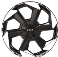
Yengil qotishmali disklar 19"