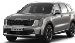
Volcanic Sand Brown (BN4)