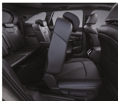
Tugmani bir marta bosish orqali soddalashtirilgan ikkinchi qatorga kirish tizimi