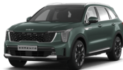
Cityscape Green (CGE)