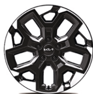
Yengil qotishmali disklar 18"