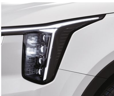
Proyeksion yorug'liodli faralar