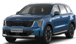
Mineral Blue (M4B)