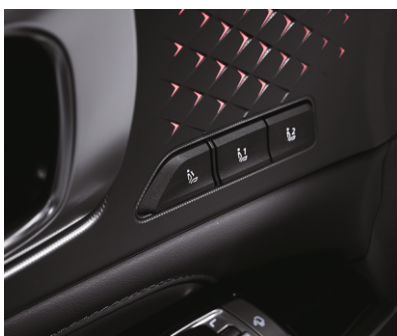
Haydovchi o'rindig'ining sozlamalar xotirasi