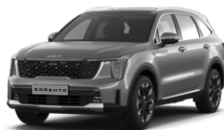
Steel Gray (KLG)